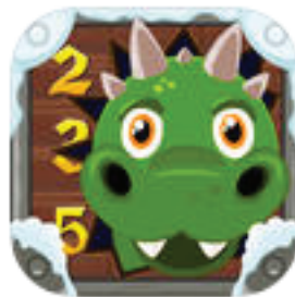
Sudoku - een draken avontuur

Ik heb ook een leuke origami app en sudoku app.