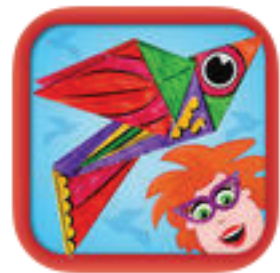
Origami voor kinderen